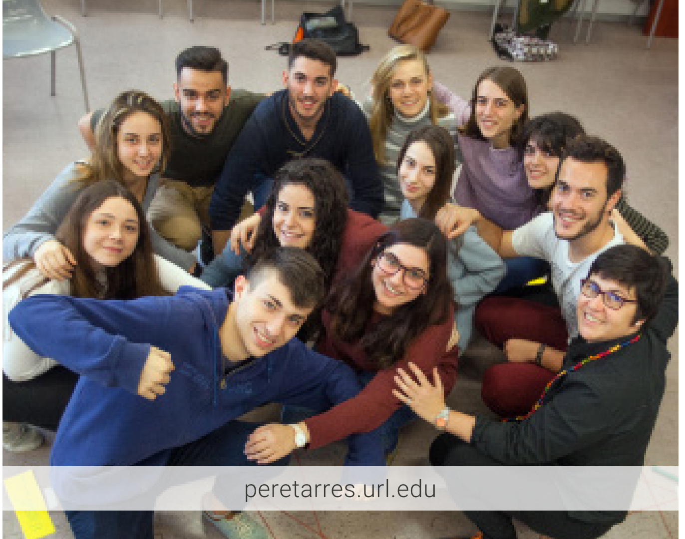
Fotos amb la col·laboració d'estudians i professors de la Facultat Pere Tarrés